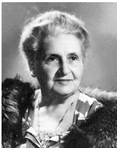
Мария Монтессори – выдающийся ученый, педагог-мыслитель, (1870-1952)

«Дети – слабые человеческие существа, живущие среди сильных, они не поняты, их потребности не приняты в обществе взрослых, и это таит в себе бездну непредвиденного зла».